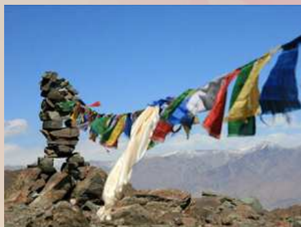
Le stupa sur les hautes montagnes

La philosophie tente de dépasser la pensée magique vers une pensée théorique. Le 20e siècle a été prolifique en idéologies.